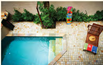
QUINTAL COM PISCINA

4 suítes | 200 m 2 privativos | 3 vagas + 1 vaga de visitante | Piscina e Churrasqueira privadas | Depósito individual | Escritura definitiva