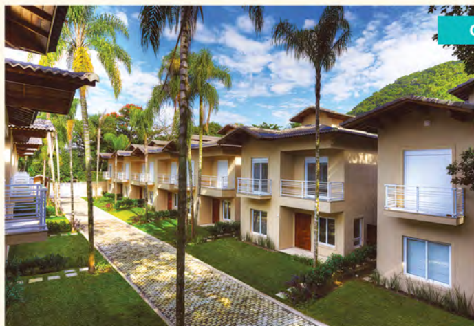
FOTO DA ALAMEDA DO EMPREENDIMENTO