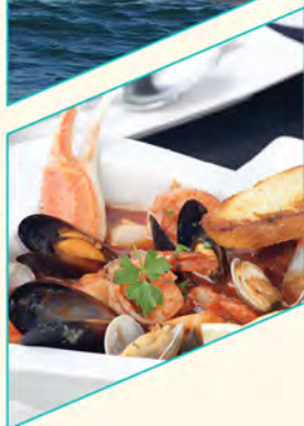
Gastronomia renomada: Ogan, Manacá, Acqua e Azul Marinho