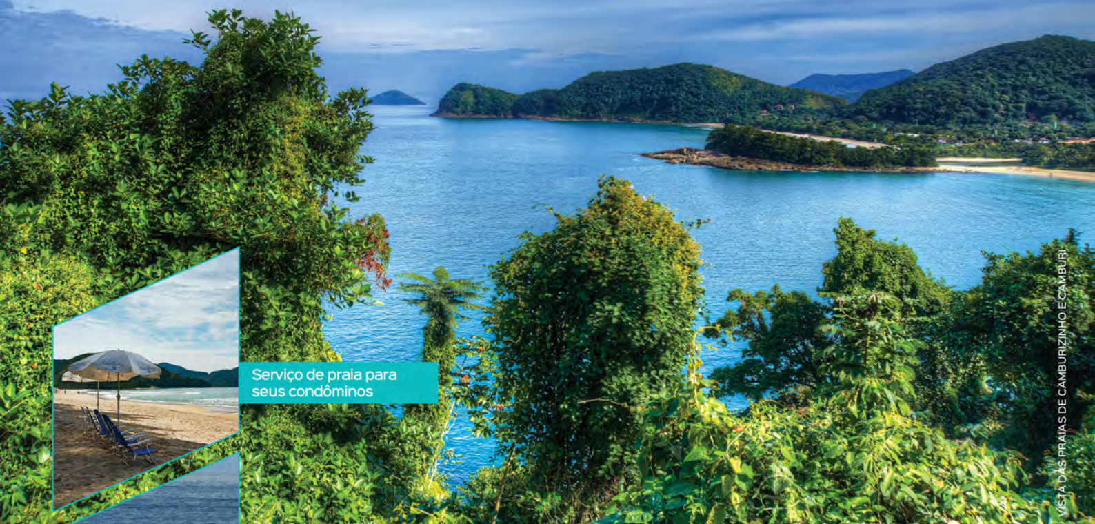
VISTA DAS PRAIAS DE CAMBURIZINHO E CAMBURI

A poucos passos da praia. Um projeto que une natureza, conforto e preço.