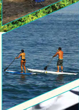
A 10 min. da Baleia de stand up