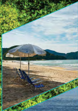
Serviço de praia para seus condôminos