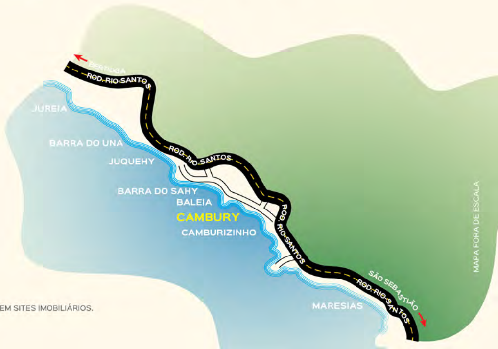
MAPA FORA DE ESCALA